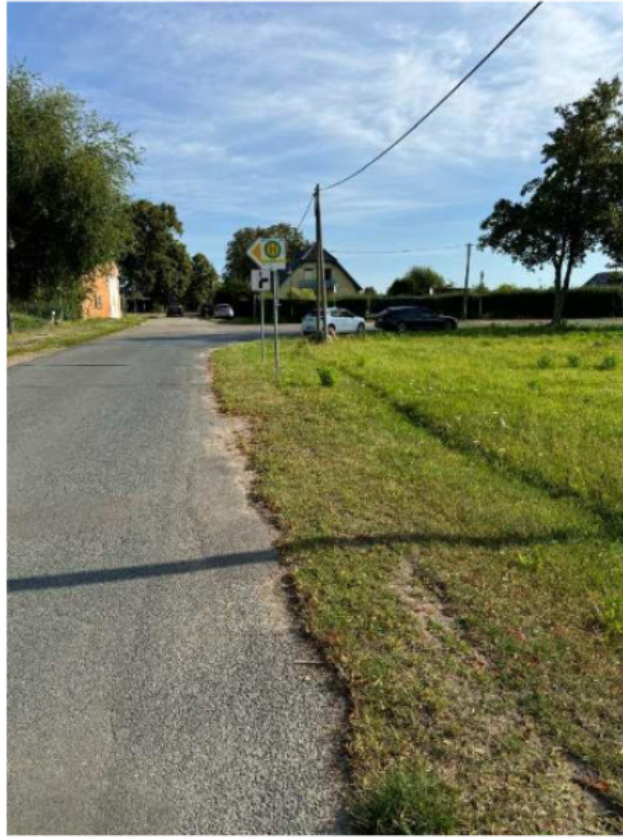
Bushaltestelle Richtung Steindamm